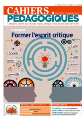
Cahiers pédagogiques Former l'esprit critique N°550, janvier 2019

La formation à l'esprit critique, c'est bon pour tous les âges et toutes les disciplines : le dossier en propose de nombreux exemples concrets. Mais il ne s'agit pas d'amener à tout relativiser, plutôt de défendre un effort de rationalité et d'intelligibilité.